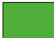
Baignade surveillée sans danger