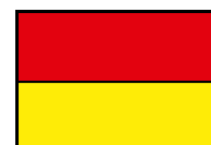
Zone de baignade surveillée pendant les horaires d'ouverture du poste de secours